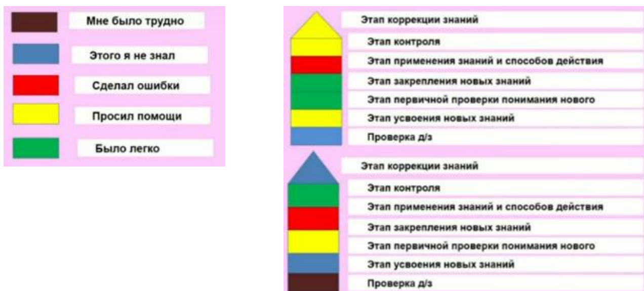
Рисунок 4. Строим здание