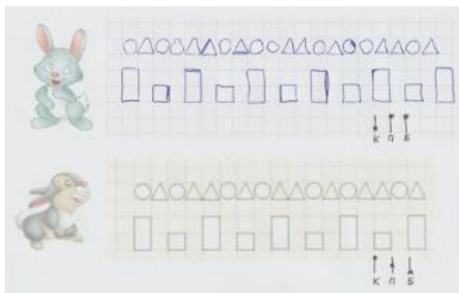
Рисунок 1. Критериальное оценивание, 1 класс

С 1 класса, совместно с детьми можно вырабатывать критерии оценивания. К примеру, в начале 1 класса уже обсуждается два направления оценивания - это правильность и аккуратность. Оценивая свою работу, ученики понимают, над чем им предстоит ещё работать (рисунок 1).