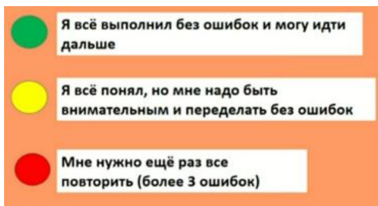
Рисунок 5. Светофор